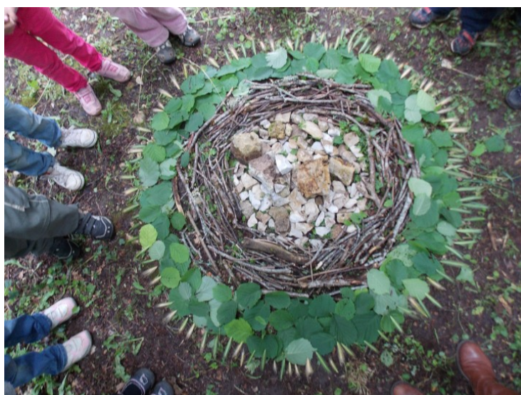
Atelier Land Art avec les élèves de lécole maternelle de Dégagnac