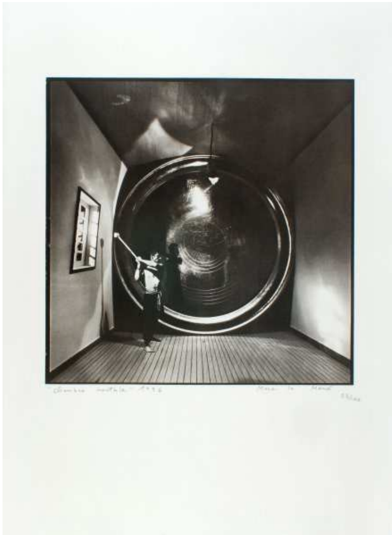
Marc Le Mené, chambre mentale , 1994, photographie ©2000 Marc Le Mené

En rapport avec l'actualité des Ateliers des Arques ou selon les thématiques sur lesquelles vous travaillez, allez à la rencontre d'une œuvre par le biais d'une médiation orale, sous forme d'analyses, d'argumentations, de comparaisons et de dialogues.